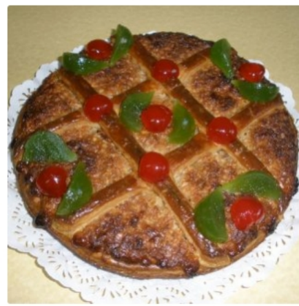
Tarta de Mondoñedo 4-6 raciones