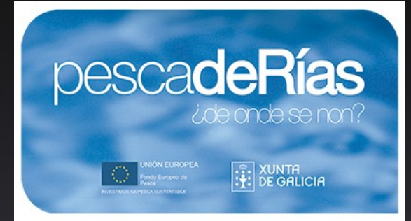
Marca de garantía