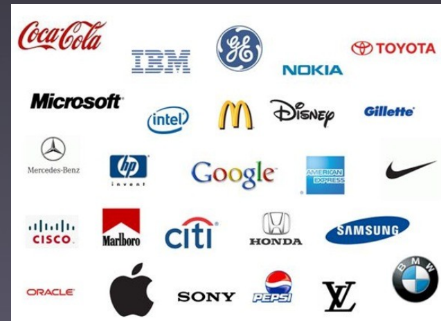
Marcas notoriamente coñecidas